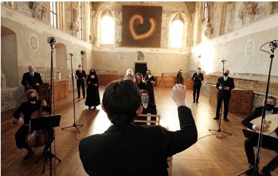
Video Sepulto domino, Pražská křižovatka

Omezení koncertního života využilo Collegium 1704 jako příležitost k objevování nových možností komunikace s posluchači online. V dubnu 2020 natočilo v Pražské křižovatce – kostele sv. Anny úspěšnou sérii tří videí, která byla zveřejněna na platformě YouTube a setkala se s velkým ohlasem v ČR i v zahraničí: