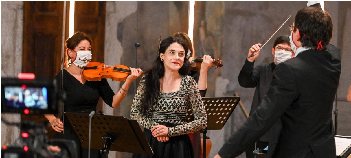
Collegium 1704 z Pražské křižovatky, Pražské jaro

Collegium 1704 se zapojilo také do projektu Bach Marathon 2020 v rámci prestižního Bachfest Leipzig. Koncert Lamenti byl vysílán živě v rámci streamu Bachových děl.