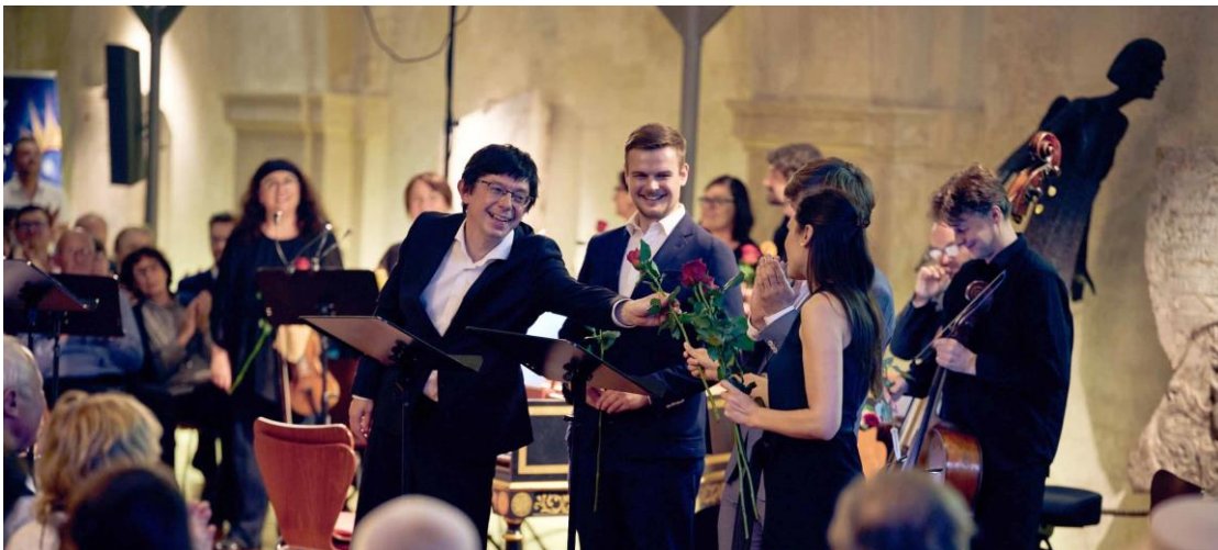
Kaffee-Kantate, mimořádný koncert, Pražská křižovatka – Kostel sv. Anny

10 / 12 / 2020 Mirabile mysterium J. Gallus, F. Poulenc PŘESUNUTO na sezónu CV 1704 2021