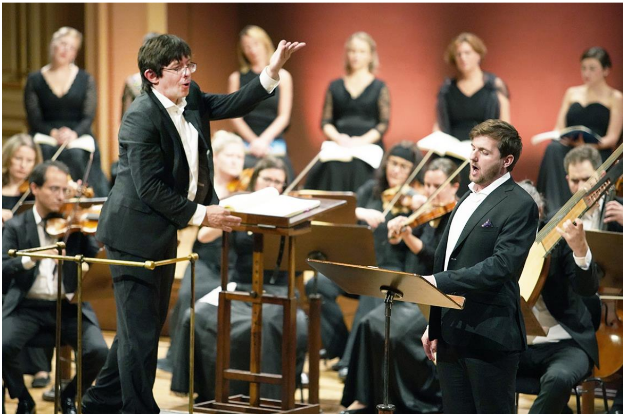
Koncertní cyklus Sezóna Collegia 1704 v Rudolfinu

W. A. Mozart — Korunovační mše W. A. Mozart — Kyrie K. 341 W. A. Mozart — Miserere K. 85 W. A. Mozart — Misericordias Domini K. 222 silvestrovský & novoroční koncert | NEREALIZOVÁNO