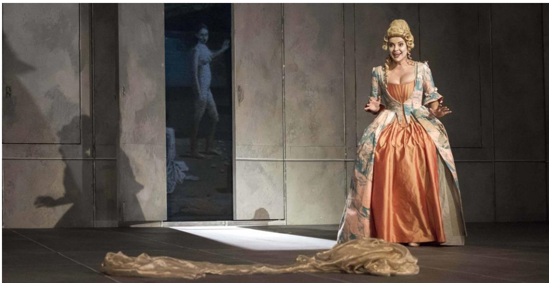
A. Vivaldi – Arsilda, regina di Ponto , režie: D. Radok, dirigent: V. Luks