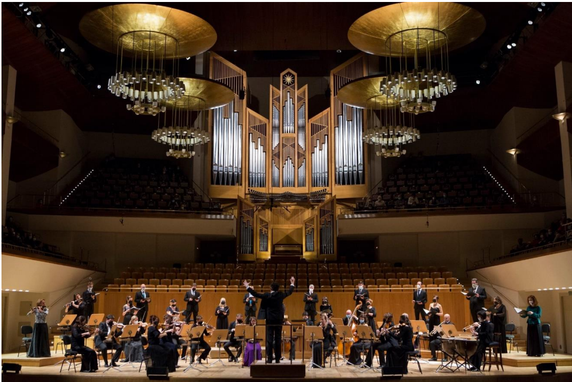
CNDM Madrid, dirigent Václav Luks, Collegium 1704 a Collegium Vocale 1704