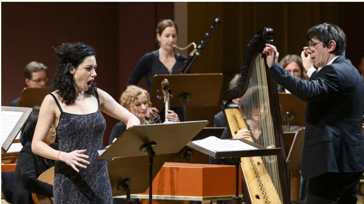
Koncertní cyklus Sezóna Collegia 1704 v Rudolfinu

V roce 2020 mohly být uskutečněny pouze 2 koncerty v Rudolfinu a 2 koncerty v Annenkirche , na nichž zazněla oratoria San Giovanni Battista A. Stradelly a Mesiáš G. F. Händela. Ostatní koncerty Sezóny v Rudolfinu a Hudebního mostu Praha-Drážďany byly z důvodu zákazu hromadných akcí v souvislosti s pandemií Covid-19 zrušeny bez náhrady nebo transformovány do online projektu UNIVERSO 1704 .