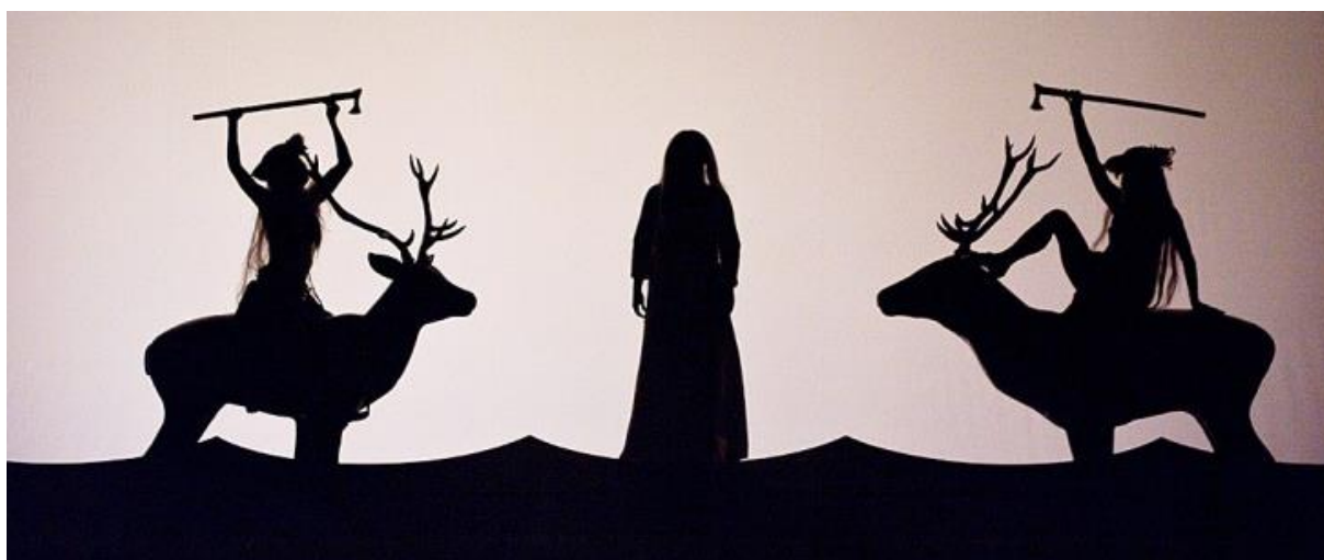
Julius Zeyer: Radúz a Mahulena, ND v Praze