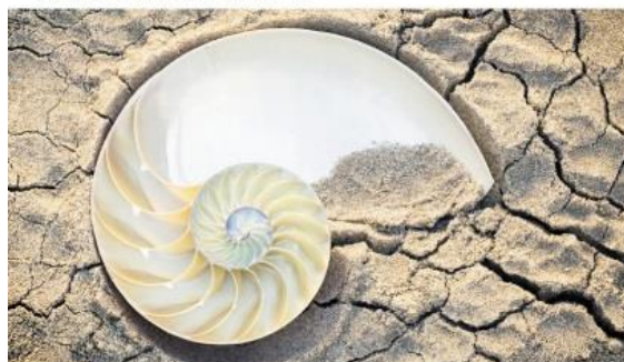
Collegium 1704 Et Collegium Vocale 1704 Václav Luks